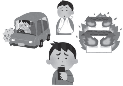
事故が発生したらすぐに連絡することが大切です。